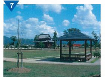
▲紀伊国分寺の整備(完了)<紀の川市>