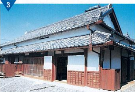
▲春林軒の整備(完了)<紀の川市>