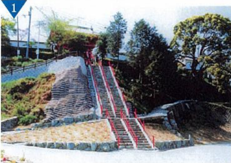
▲勝利寺の石段整備(完了)<九度山町>