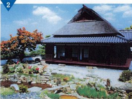
▲古沢紙(高野紙)の伝承施設「紙遊苑」整備(完了)<九度山町>