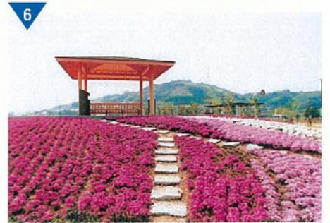
▲道の駅「紀の川万葉の里」整備(完了)<かつらぎ町>