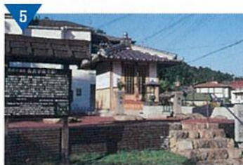
▲名古屋鹿寺周辺整備(完了)<高野口町>