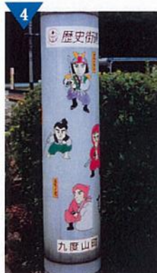
▲真田十勇士のイラストを描いた「電柱修景シート」(完了)<九度山町>