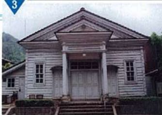
▲旧生野警察署の整備(完了)