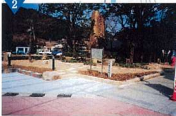
▲生野義拳碑周辺整備(完了)