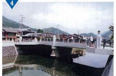
▲盛明橋の整備(完了)