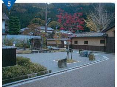
▲カラミ石広場整備(完了)