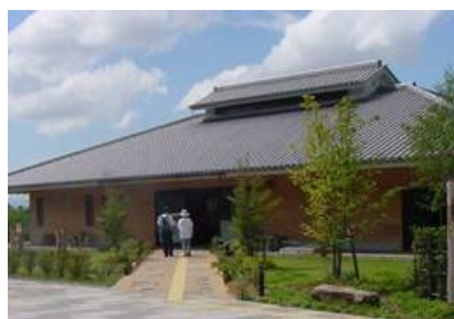
天理市トレイルセンター