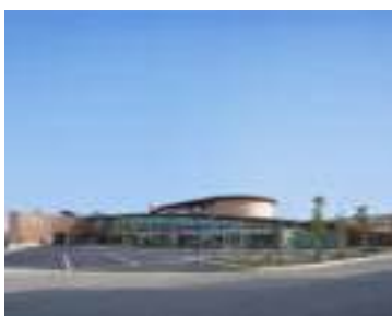
高槻市今城塚古代歴史館