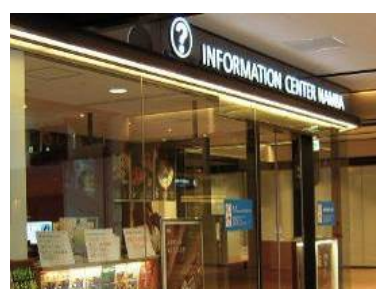
なんば南海インフォメーションセンター