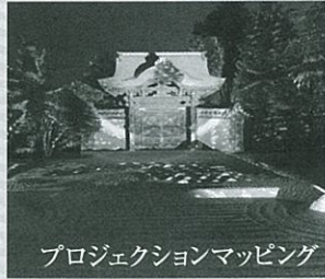
プロジェクションマッピング